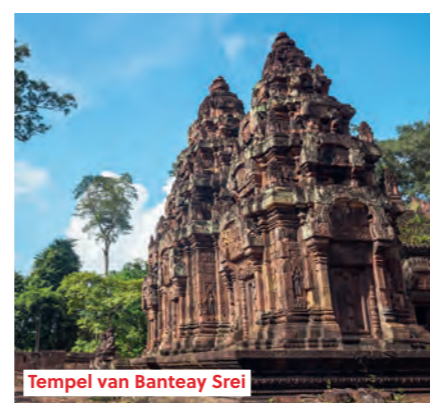
Tempel van Banteay Srei