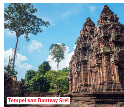
Tempel van Banteay Srei

In de ochtend vertrekken we naar Angkor en de koninklijke stad Angkor Thom, een van de oude hoofdsteden van het Khmer-rijk. We bezoeken de tempel van Bayon.