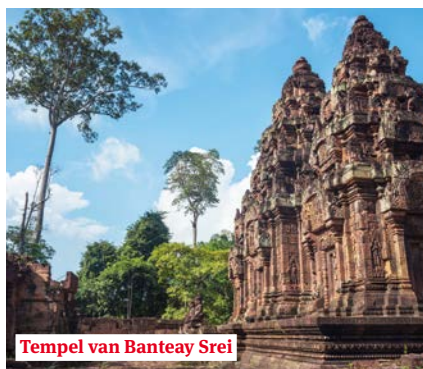
Tempel van Banteay Srei

In de ochtend vertrekken we naar Angkor en de koninklijke stad Angkor Thom, een van de oude hoofdsteden van het Khmer-rijk. We bezoeken de tempel van Bayon. Met zijn 54 torens, versierd met meer dan twee-